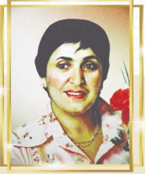
Bakı 28 aprel 2025 il